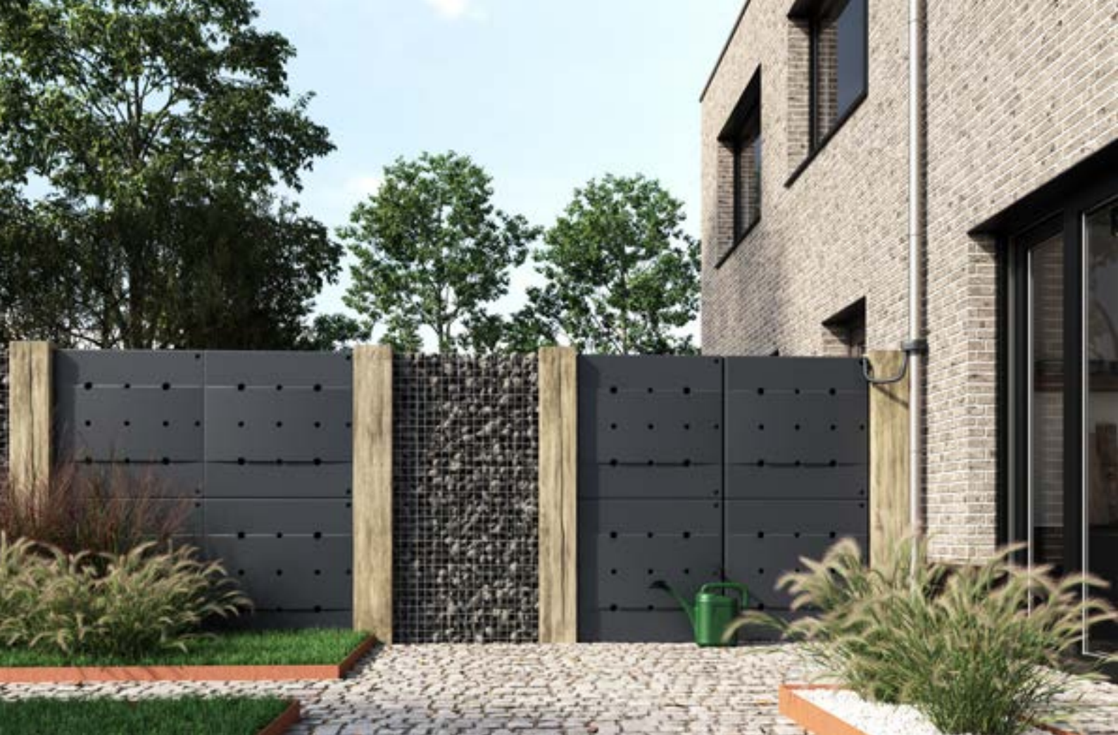
De Rainblock geplaatst als tuinafscheiding.