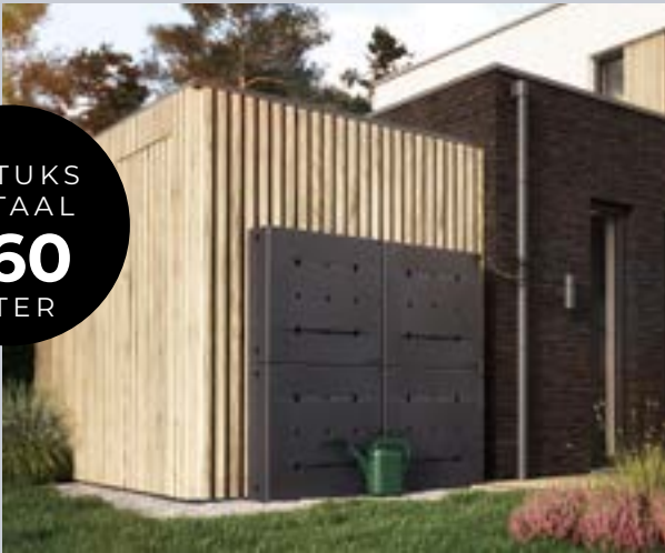
Kleur: Zwart, geplaatst als muuropstelling

We love Rain. Dat klinkt misschien vreemd, maar toch is het zo. Door het veranderende klimaat zullen we steeds verantwoordelijker om moeten gaan met drinkwater. Overheid en gemeenten sturen steeds meer aan op opslag van regenwater voor gebruik op momenten dat je het water wel nodig hebt. Met het innovatieve Rainblock®-systeem kun je op een efficiënte en mooie manier regenwater opslaan. Dankzij het compacte ontwerp kan de Rainblock® verwerkt worden in een tuinafscheiding of muuropstelling. Het modulaire systeem kan worden uitgebreid met infiltratiekragen of bijvoorbeeld een bewateringssysteem.